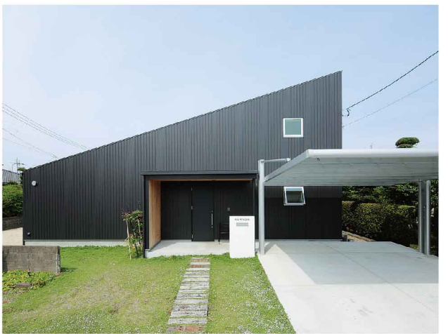
ガルバリウム材の真っ黒な片流れ屋根が印象的。クラピアにユーカリの枕木、真っ白なカーポートも絶妙。今年は屋根に太陽光発電システムも設置した