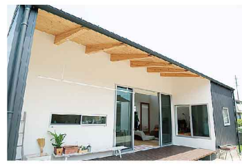
ウッドデッキは広い庭につながる。「家で食べる野菜を家庭菜園で収穫できたらうれしい」と奥さま

休日はウッドデッキでバーベキュー。庭に出て、泥んこになって遊んだり、夏は水遊びをしたり